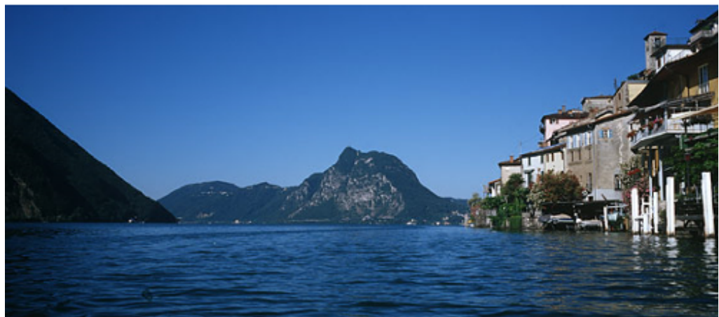
Gandria, Lago di Lugano